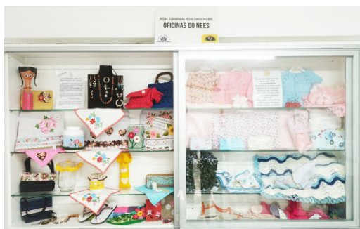
Produtos produzidos nos NEES pelas alunas das Oficinas.

Quando momentaneamente separados, os Espíritos, ao regressarem ao plano espiritual, se reúnem novamente, fortalecidos pelos laços familiares, conforme a mútua estima que os liga. “Com a pluralidade das existências, inseparável da progressão gradativa, há a certeza na continuidade das relações entre os que se amaram, e é isso o que constitui a verdadeira família.” Aqueles que fracassam no caminho, retardam o seu adiantamento e a sua felicidade, mas serão ajudados, encorajados e amparados pelos que os amam. Com a reencarnação, enfim, há perpétua solidariedade entre os encarnados e os desencarnados, do que resulta o fortalecimento dos laços de afeição.